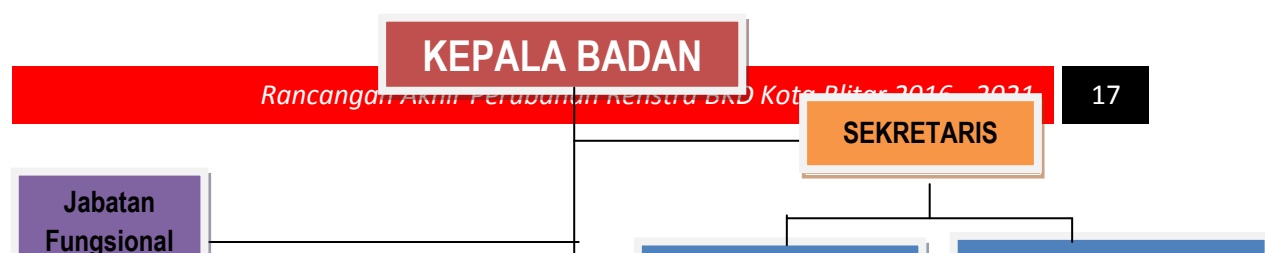
Gambar 2.1. Bagan Struktur Organisasi Badan Kepegawaian Daerah Kota Blitar

Adapun struktur organisasi Badan Kepegawaian Daerah Kota Blitar berdasarkan Peraturan Walikota Kota Blitar Nomor 76 Tahun 2016 disajikan sebagai berikut :